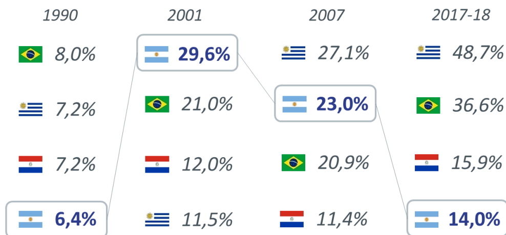
Stock de IED en economías del MERCOSUR como % del PIB

En segundo lugar, la expansión deberá ser diferente porque deberá tener un sesgo hacia los bienes transables . Hasta el momento, la Argentina ha mostrado una gran versatilidad para ajustar su sector externo. El déficit de cuenta corriente del primer trimestre de este año ha sido un 60% más bajo que el del primer trimestre del año 2018: pasó de 9369 millones de dólares a 3849 millones. Es un ajuste realmente encomiable. Pero el mismo se hizo, sobre todo, comprimiendo las importaciones. Si la economía se reactivara siguiendo las mismas pautas de la última década, las importaciones volverían a crecer rápidamente como ocurrió en 2017, sin ir más lejos. Elo no sería consistente con los casi 800 puntos básicos de riesgo país. Con este riesgo no hay prácticamente acceso al mercado internacional de capitales. Así, la reactivación, para ser viable, tendrá que tener un sesgo pro-exportador y pro-inversión extranjera directa. Las dos condiciones esenciales para llenar estos requisitos son un tipo de cambio real que no se aleje de su equilibrio de largo plazo y un clima de negocios que atraiga las inversiones. La perspectiva de que se materialice el acuerdo con la Union Europea puede ayudar de manera crucial en esto último.